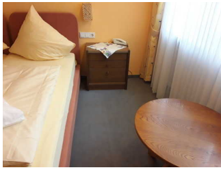
Schlafraum Zimmer 20