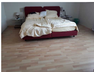
Schlafraum Zimmer 10