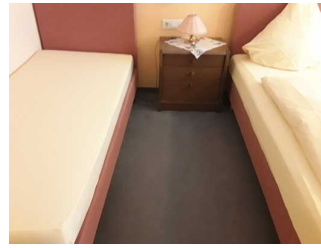
Schlafraum Zimmer 20