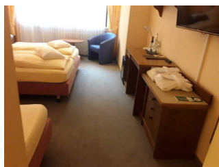
Schlafräum Zimmer 20