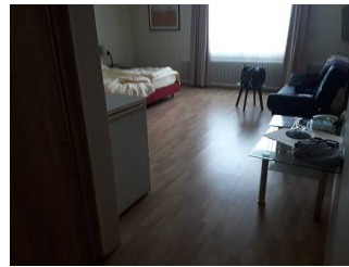
Schlafraum Zimmer 10